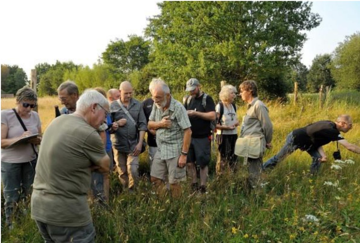
De jaarlijkse verbroedering van SAP en SLOB