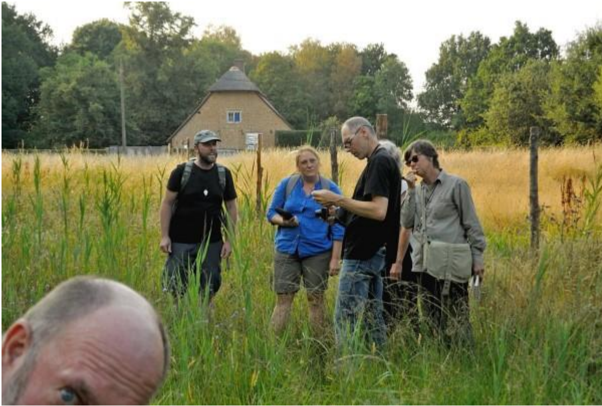
Ja Guido Isabelle trekt ook foto's