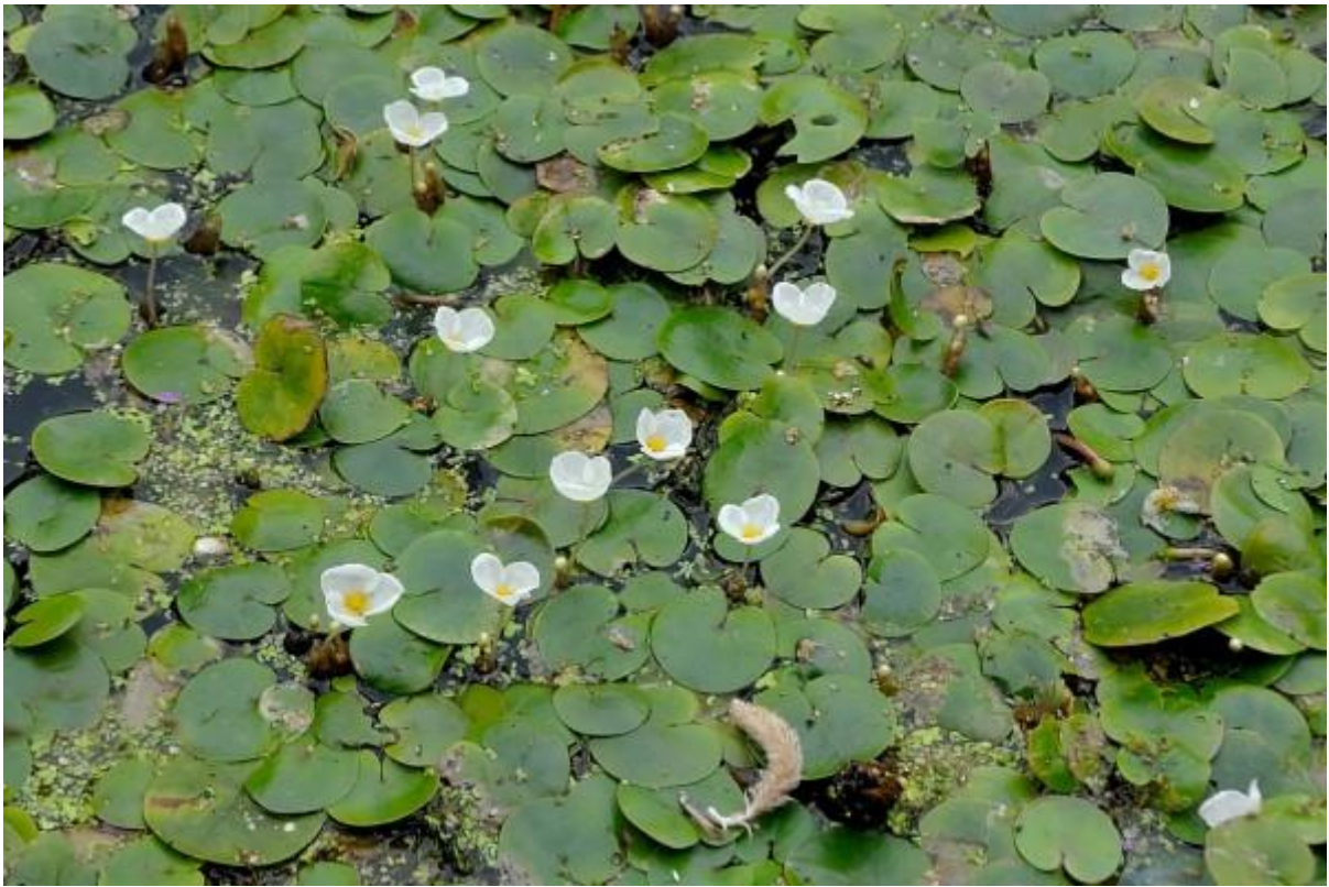
Een vijver vol kikkerbeet