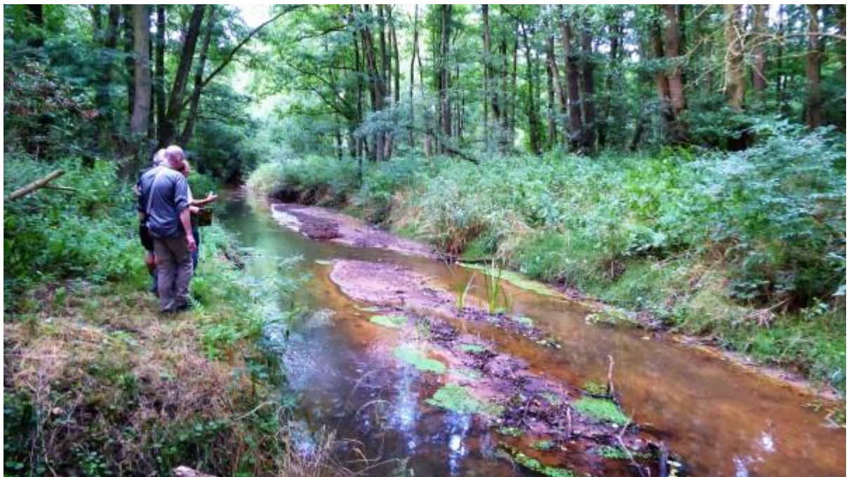
Zo zien we de Dommel niet dikwijls