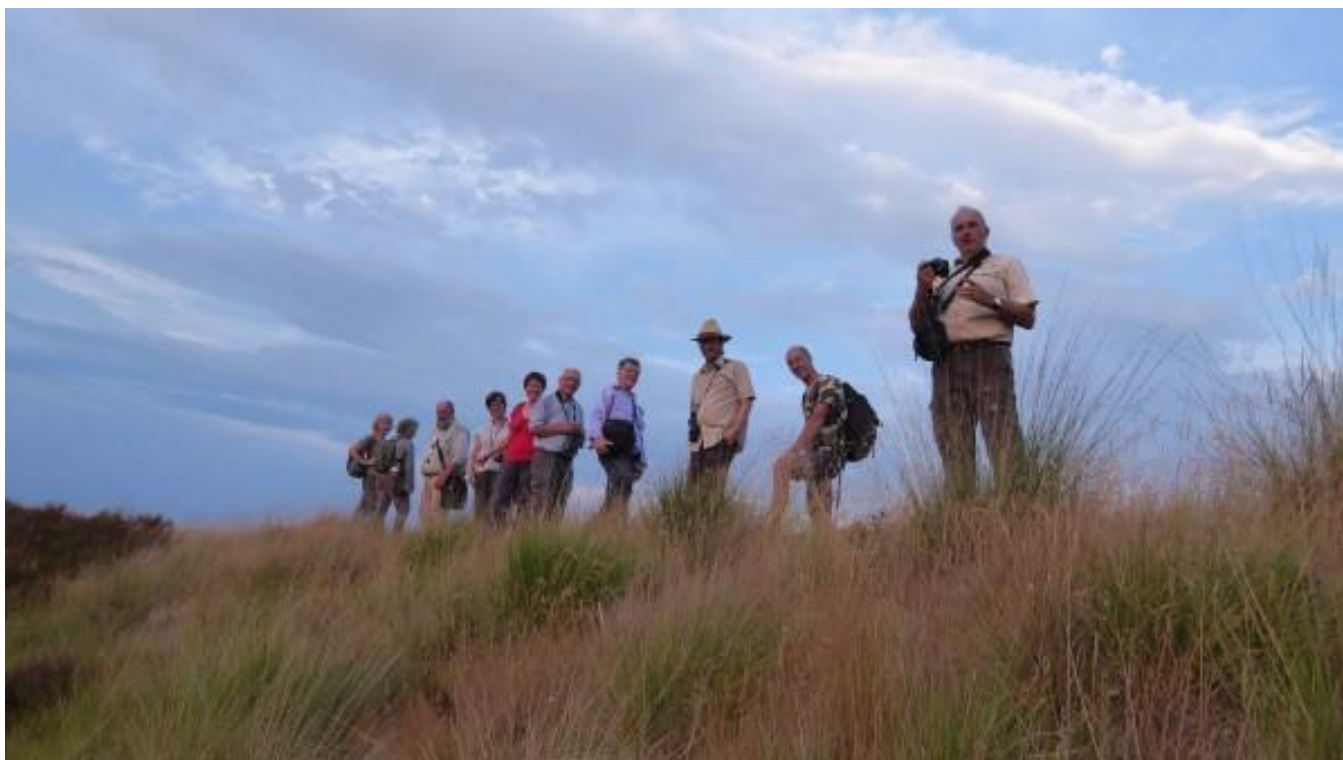
Een extraatje op het militair domein